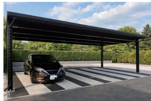
【自由設計 間口 9.54m】

当社は、本カタログ掲載の仕様以外にもお客様の敷地条件や用途などに応じて自由設計が可能です。 ご要望に応じて現地確認、無料設計、無料見積もりをいたしますので、お気軽にご相談ください。